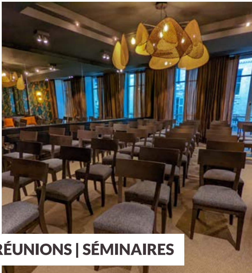
RÉUNIONS | SÉMINAIRES

Vous souhaitez organiser un événement professionnel ou privé dans le salon privatif du restaurant Bon Temps ?