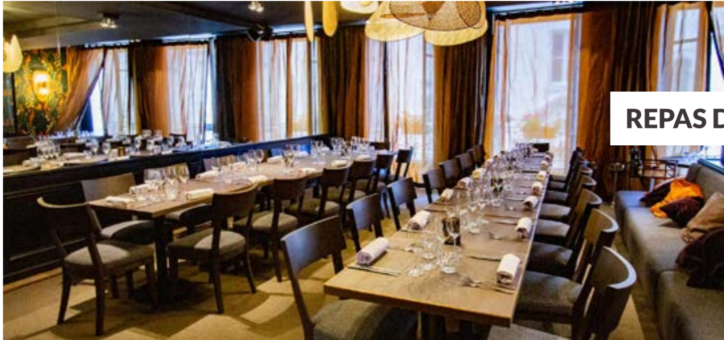
REPAS DE GROUPE